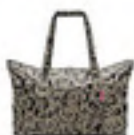
AG 7061 baroque marble