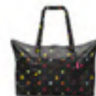
AG 7009 dots