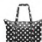
AG 7073 dots white