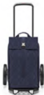
MJ 4110 rhombus midnight

AUSLIEFERUNG/DELIVERY: FEBRUAR/FEBRUARY 2024