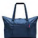
AG 4059 dark blue