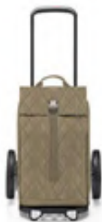
MJ 5046 rhombus olive