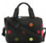
ZK 7009 dots