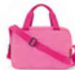
ZK 3094* twist pink