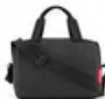
ZK 7003 black