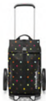
MJ 7009 dots