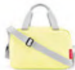
ZK 2035* lemon ice