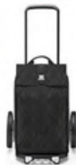
MJ 7059 rhombus black