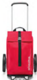
MJ 3004 red

AUSLIEFERUNG/DELIVERY: OKTOBER/OCTOBER 2023