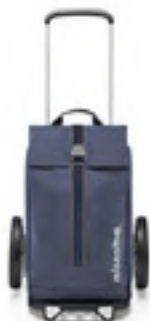
MJ 4113 herringbone dark blue