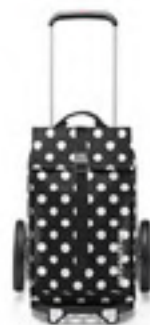
MJ 7073* dots white