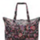
AG 7064 paisley black