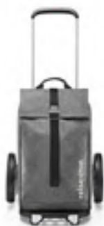
MJ 7052 twist silver