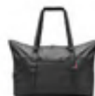
AG 7003 black