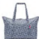
AG 4073 signature navy