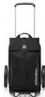
MJ 7003 black