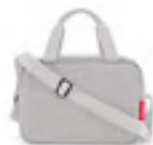
ZK 1035 twist sky rose