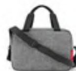
ZK 7052 twist silver